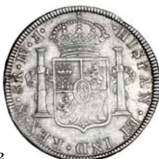
572 8 reales. 1772. México. FM invertido. VI-932. Rayitas en anv. y vano en rev. MBC/MBC+.