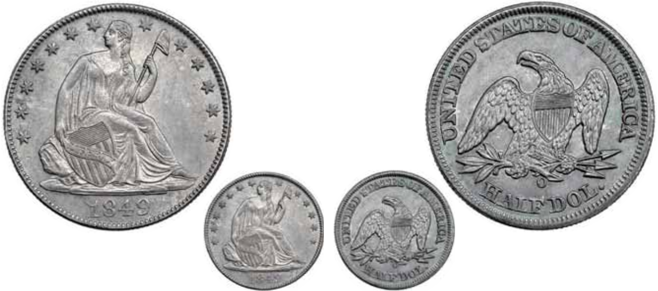
744 1/2 dólar. 1849 O. NGC-MS 63.