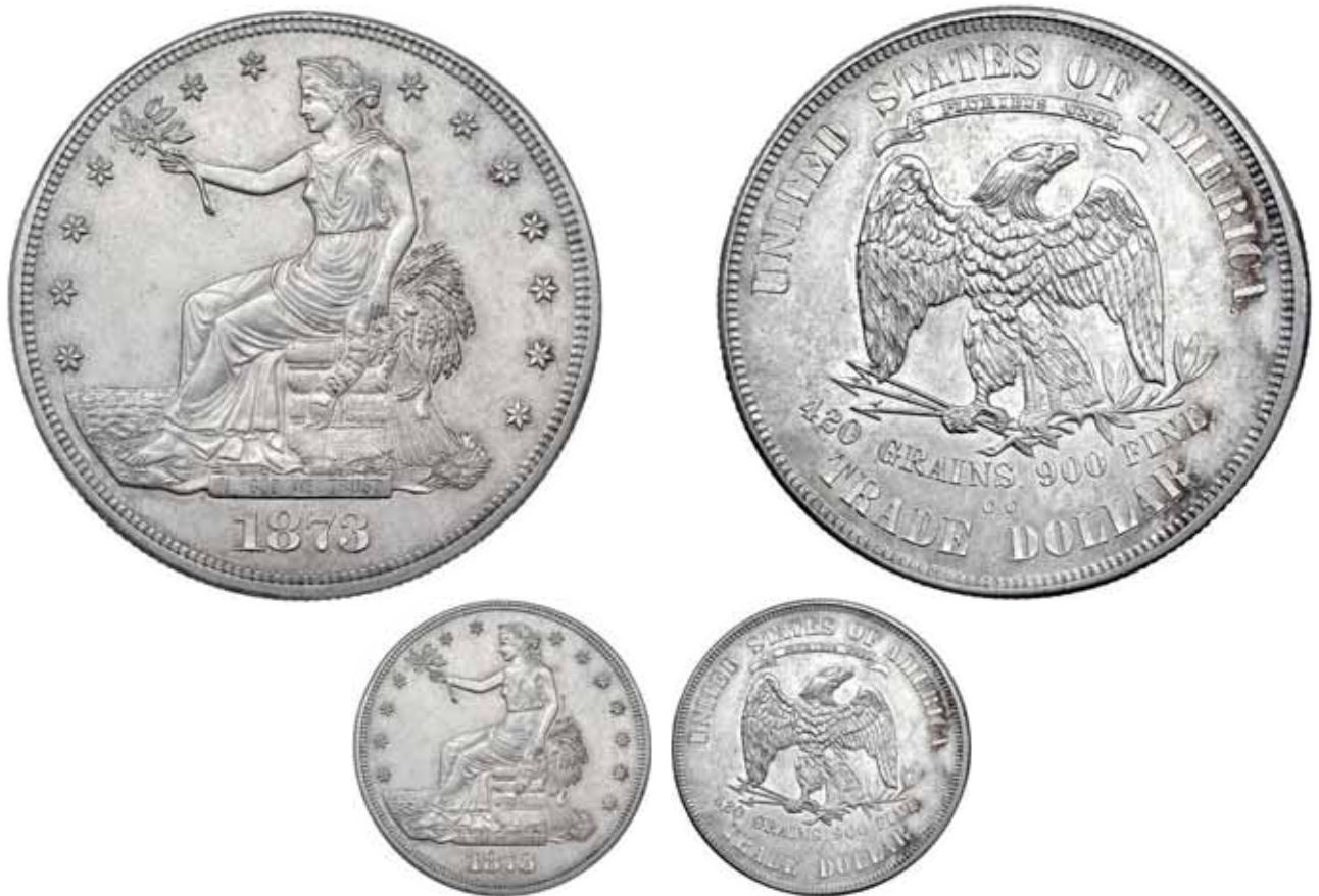
745 Trade dollar. 1873. CC. NGC-UNC cleaned.