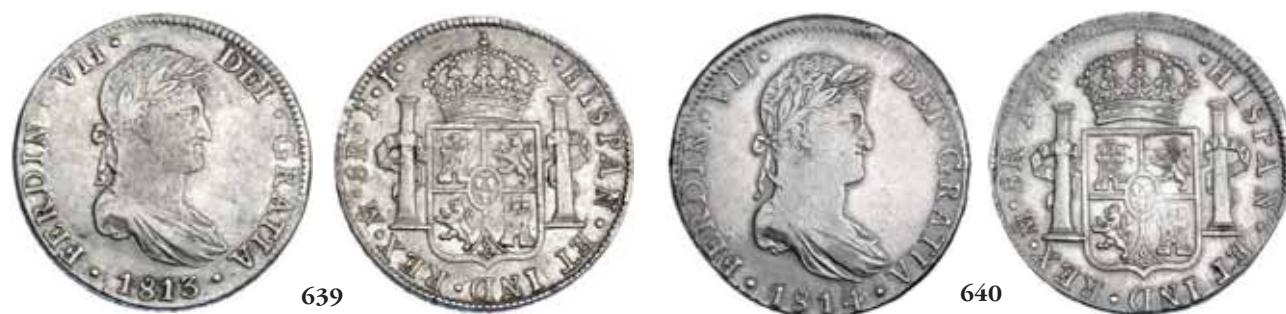
639 8 reales. 1813. México. JJ. VI-1092. MBC/MBC+. 65 640 8 reales. 1814. México JJ. VI-1094. MBC+. 60