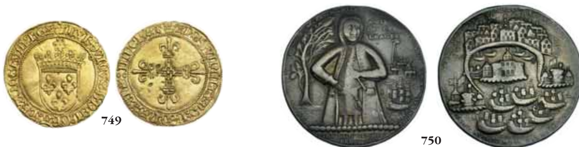
FRANCIA 749 Luis XII. Escudo de la corona. FRB-323 (71). MBC+. 550 GRAN BRETAÑA 750 Medalla. Vernon. 1739. Portobello. AE 39 mm. MBC-. 125