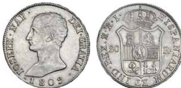
616 20 reales. 1809. Madrid. AI. VI-30. Ligera plata agria. MBC+.