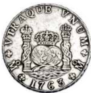
565 8 reales. 1763/2. México. MM. VI-920. MBC. Rara.