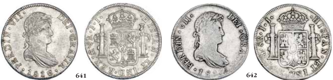
641 8 reales. 1816. México. JJ. VI-1096. Ligerá plata agría en rev. MBC+/EBC-. 100 642 Similar a la anterior. Vanos. MBC-. 35