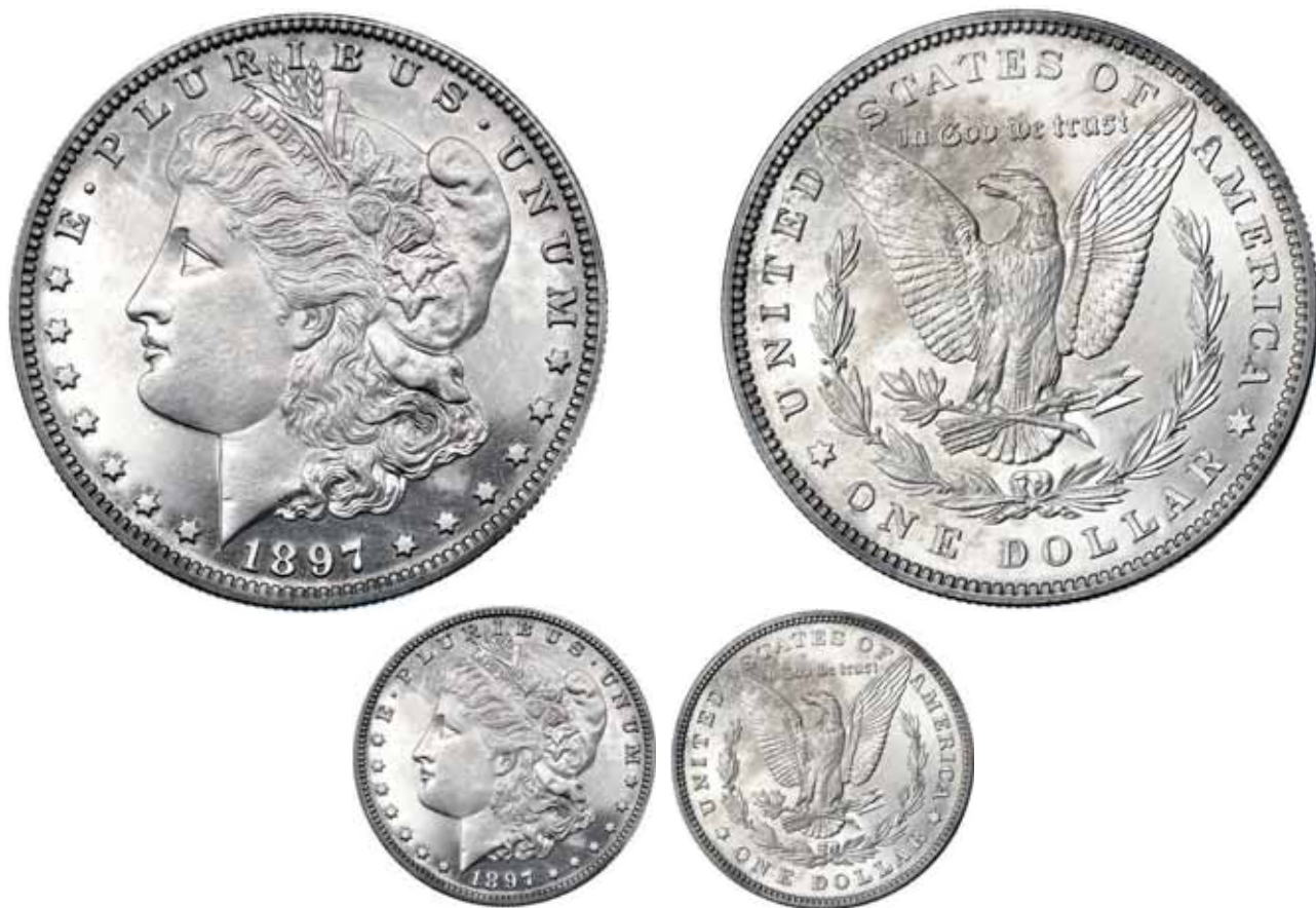
746 Dólar. 1897. NGC-PF 63. 3000