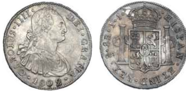
609 8 reales. 1802. Santiago. JJ. VI-844. Pátina irregular. MBC/MBC+. Escasa.