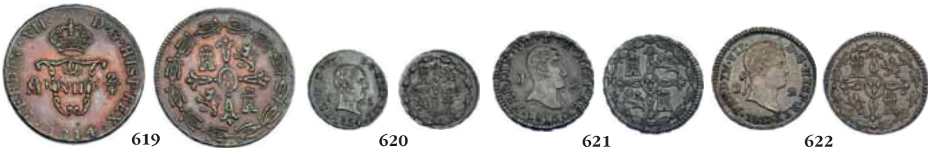
619 2/4 de Tlaco (real). 1814. México. MBC+. Escasa.