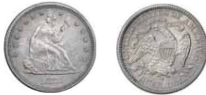
743 25 centavos. 1876 S. NGC-MS 62.