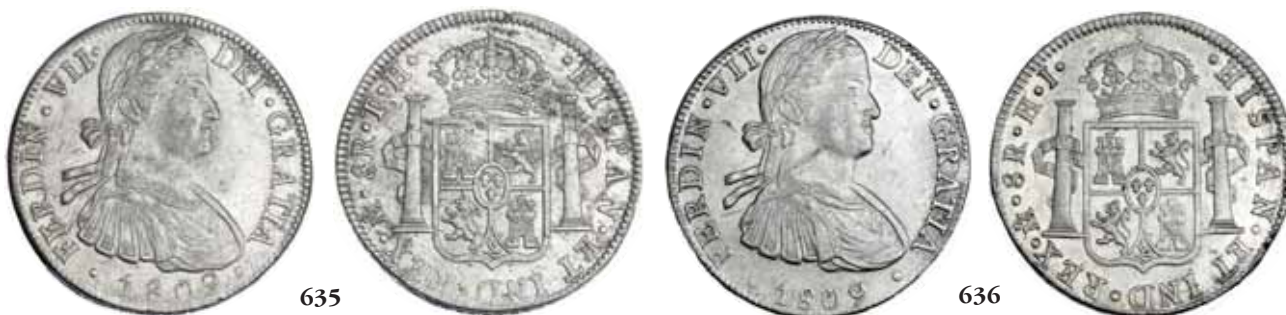
635 8 reales. 1809. México TH. VI-1083. Pequeñas marcas en rev. R.B.O. EBC-/MBC+. 75 636 8 reales. 1809. México HJ. VI-1084. Finas rayitas. R.B.O. MBC+/EBC. Escasa. 100