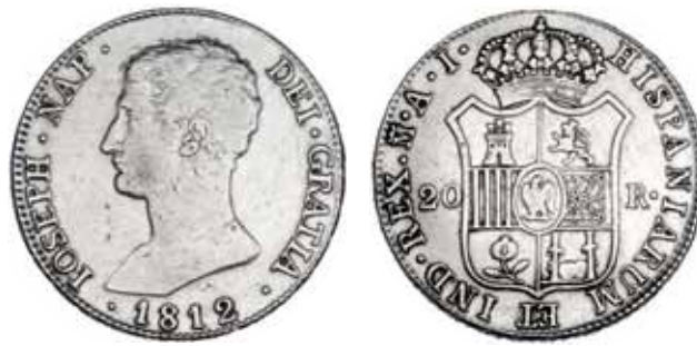
617 20 reales. 1812. Madrid. Al. VI-35. Limpiada. Pequeñas marcas. MBC-.