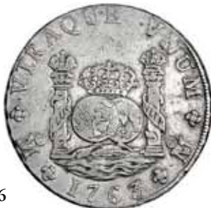
566 8 reales. 1763. México. MF. VI-921. MBC/MBC-.