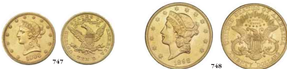
747 10 dólares 1906 D. KM-102. NGC-MS 61. 700 748 20 dólares 1898-S. KM-74.3. EBC+. 1500