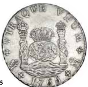
568 8 reales. 1766. México. MF. VI-924. MBC+.