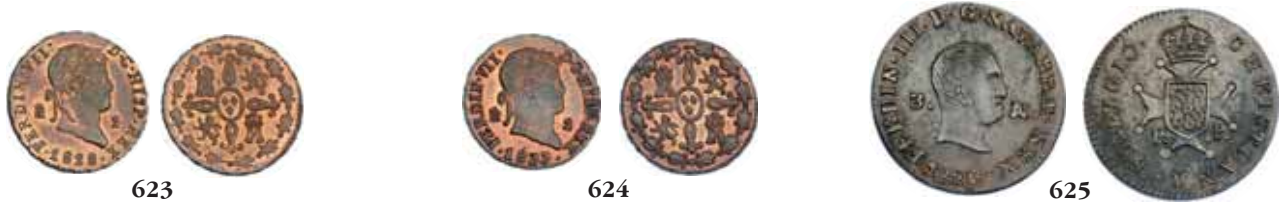
623 2 maravedís. 1828. Segovia. VI-144. Pequeñas marcas de acuñación. B.O. SC.