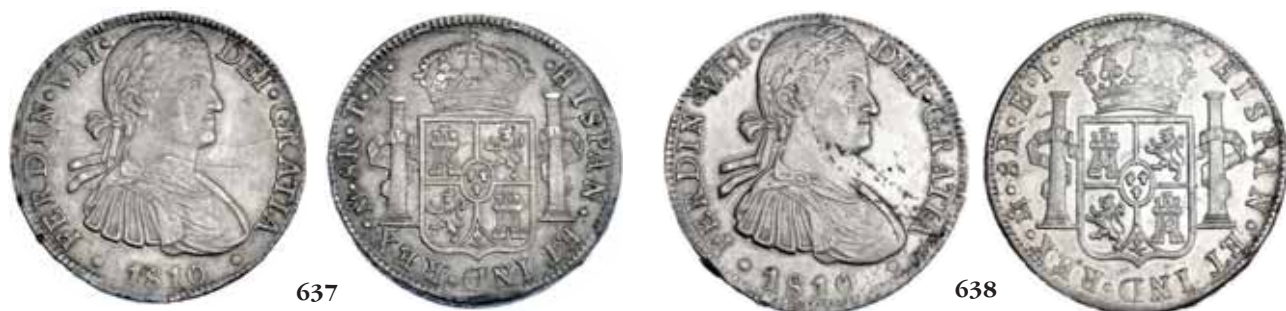
637 8 reales. 1810. México. TH. VI-1085. Pequeñas marcas de rotura de cuño. MBC+. Escasa. 100 638 8 reales. 1810. México. HJ. VI-1086. Pequeñas oxidaciones. R.B.O. MBC+/EBC. 75